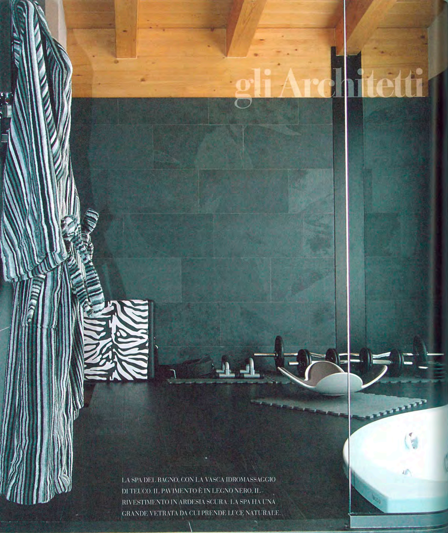
LA SPA DEL BAGNO, CON LA VASCA IDROMASSAGGIO DI TEUCO. IL PAVIMENTO È IN LEGNO NERO, IL RIVESTIMENTO IN ARDESIA SCURA. LA SPA HA UNA GRANDE VETRATA DA CUI PRENDE LUCE NATURALE.