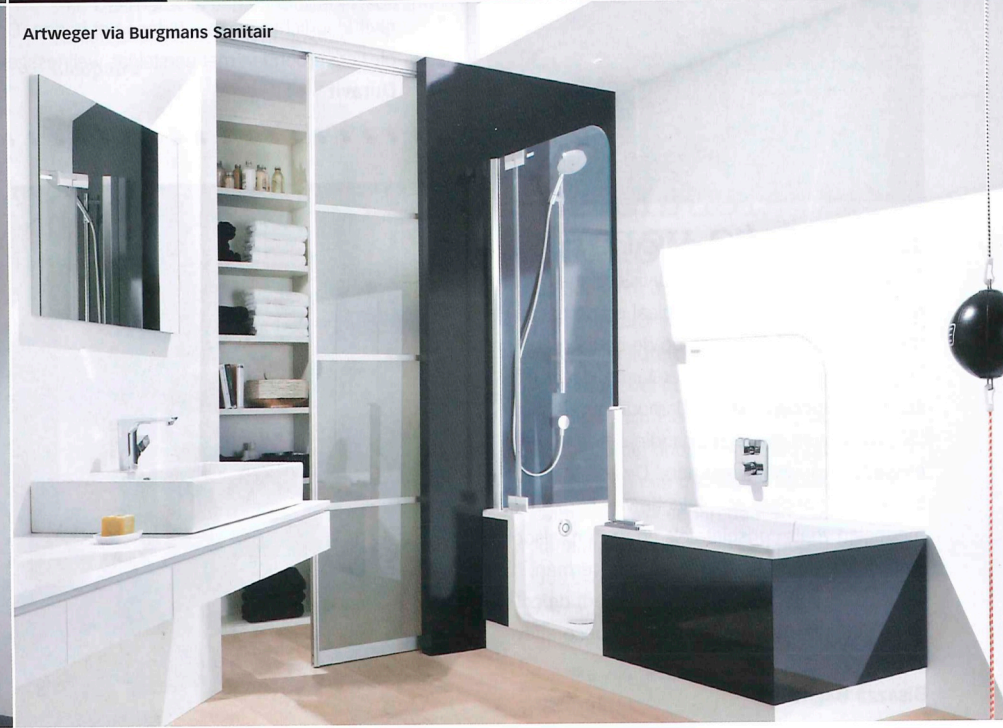
Artweger via Burgmans Sanitair