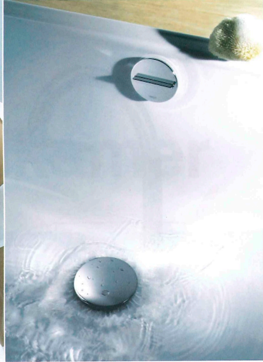
Met de Rotaplex Trio F afvoer is het mogelijk het bad vanaf de onderkant te vullen. Viega

het nadeel dat er niet geheel onmerkbaar op meerdere punten tegelijk warm water getapt kan worden. Bovendien schakelt het verwarmingssysteem tijdelijk uit bij het tappen van warm water. Bij de nieuwste typen hr-ketels zijn de problemen rond gelijktijdig tappen op meerdere punten en het tegelijk functioneren van zowel verwarming als warm water uitstekend ondervangen. Daarmee hebt u snel, veel en continu warm water op meerdere tappunten tegelijk.