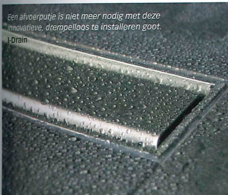
Een afvoerputje is niet meer nodig met deze innovatieve, drempelloos te installeren goot. I-Drain