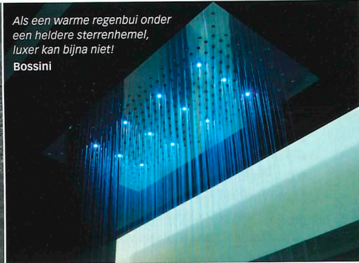
Als een warme regenbui onder een heldere sterrenhemel, luxer kan bijna niet! Bossini