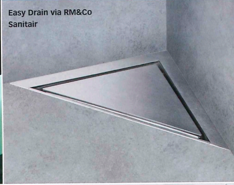
Easy Drain via RM&Co Sanitair