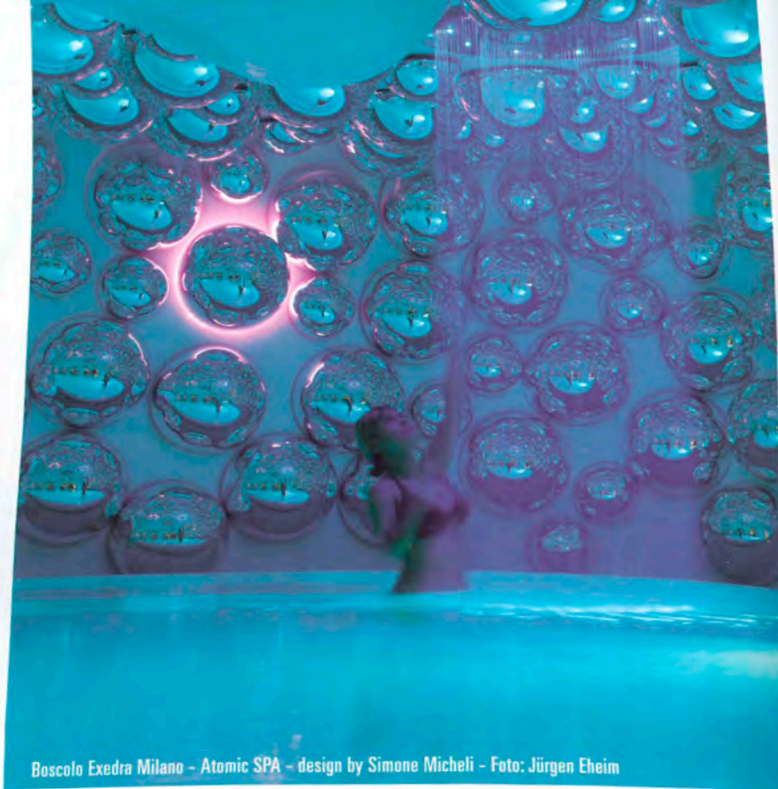
Boscolo Exedra Milano - Atomic SPA - design by Simone Micheli - Foto: Jürgen Eheim

gressivo passaggio dai settori ad alta intensità di forza lavoro e capitale ad attività produttive capaci di offrire prodotti distintivi, e soprattutto validi, dalle calzature all'alimentare, dall'artigianato all'oreficeria, dalla moda al design. Oggi, le apparecchiature idrosanitarie, i sistemi d'illuminazione, gli arredi prodotti nelle nostre fabbriche, potranno forse costare qualcosa in più di quelle provenienti da Paesi a minor costo di manodopera, ma raccolgono sempre forti consensi e permettono di dire a buon diritto che il "made in Italy" è ancora vivo e all'avanguardia. Recenti riconoscimenti ottenuti in diversi contesti internazionali, fanno inoltre dire che anche nel settore del wellness, c'è una generazione di nostri architetti che sta portando avanti una ricerca particolarmente fortunata. Insieme ad aziende che stanno concentrando la loro esperienza