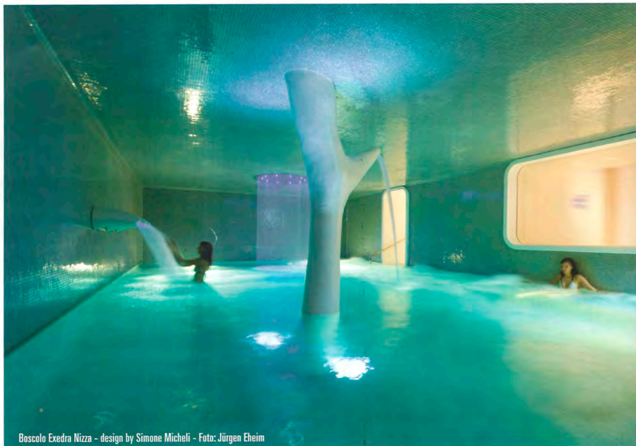
Boscolo Exedra Nizza - design by Simone Micheli - Foto: Jürgen Eheim

progettista. I risultati sono visibili, considerando che Simone Micheli con il progetto Atomic SPA all'interno dell'Hotel Exedra di Milano, si è aggiudicato il Best of Year Award 2010 nella categoria Beauty, SPA, Fitness indetto dalla rivista americana Interior Design e l'Annual Club Space Award 2010 dal Modern International Media Prize a Shenzhen in Cina, oltre al secondo posto assegnato dai lettori della nostra rivista come nuova SPA del 2010. Altra importante partnership che ha contribuito a valorizzare la creatività di archi-