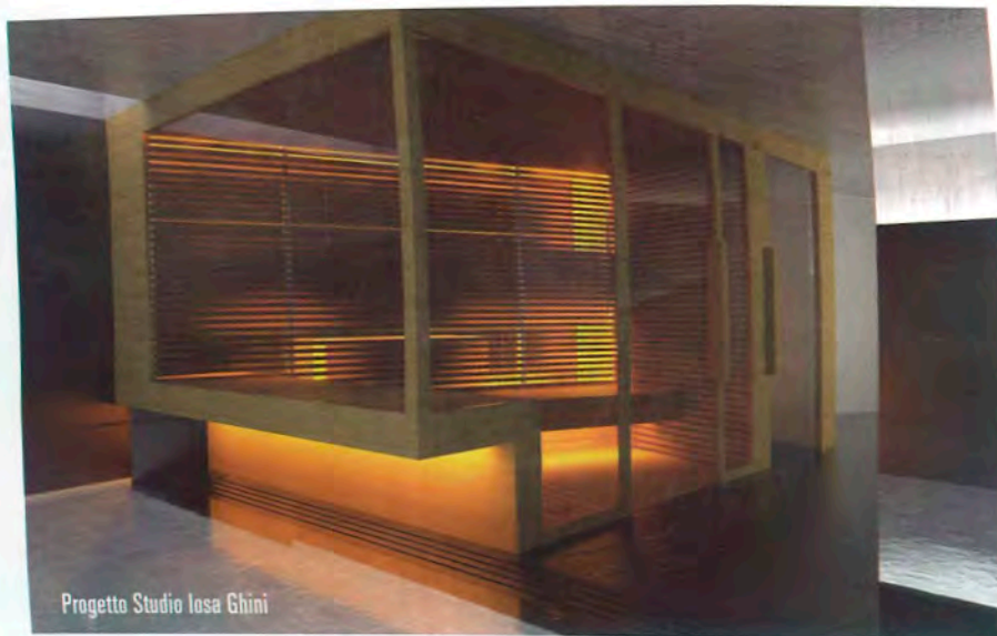
Progetto Studio Iosa Ghini