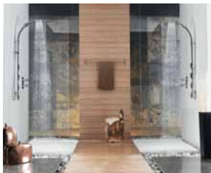
Immagine a destra, Aquabambù column