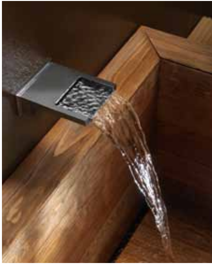
Sopra, BOCCA CASCATA Vasca e doccia A sinistra, la proposta All White Trend di Bossini per gli amanti del colore bianco Sotto, Aquavolo

Pagina accanto, Aquavolo Music Cromotherapy