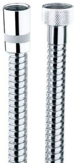
Immagine Prodotto - Product Image