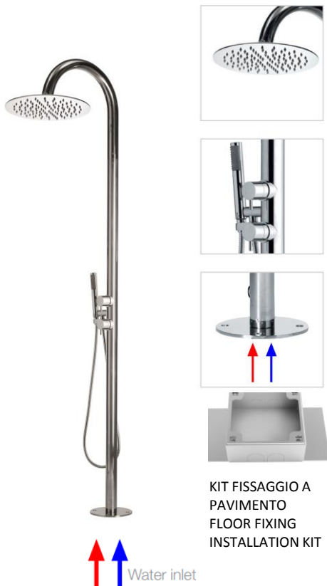
Immagine Prodotto - Product Image

Душевая колонна TETIS из стали INOX Душевая колонна укомплектована: Комплект для крепления к полу и подключению к водоснабжению (горячему и холодному) - 2 смесителя - Душ 4 mm TETIS диам. 300 мм - Ручной душ