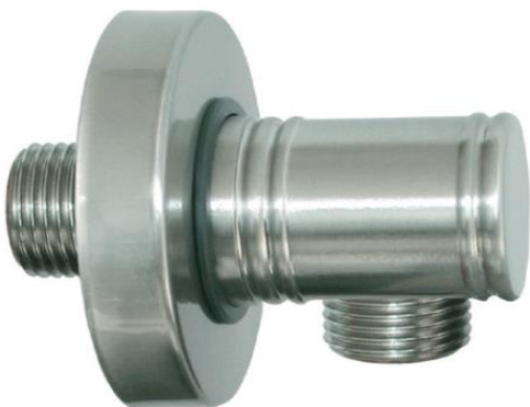
Immagine Prodotto - Product Image