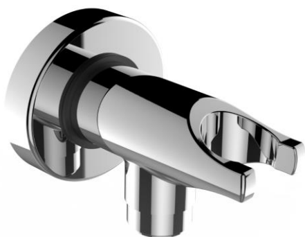
Immagine Prodotto - Product Image