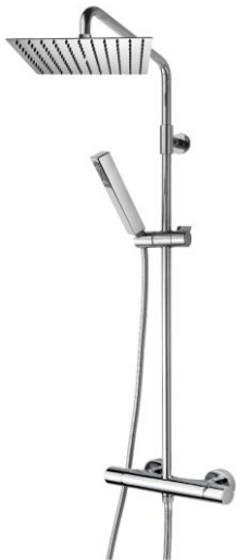
Immagine Prodotto - Product Image

настенная колонна из латуни Ø 20 мм – Душ TWIGGY 250x250 мм - CUBE Ручная лейка – держатель для лейки поворотный - Шланг латунный дв.фальцевания 150 см 1/2" FF конус - смеситель механический наружный с интегрированным переключением