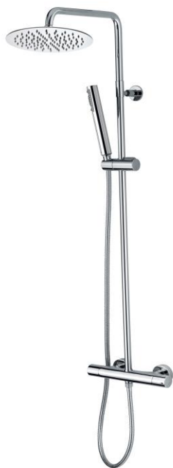
Immagine Prodotto - Product Image

настенная колонна из латуни Ø 20 мм – Душ TETIS Ø200 мм - ZEN Ручная лейка - держатель для лейки поворотный - Шланг латунный дв.фальцевания 150 см 1/2" FF конус - Смеситель термостатический с встроенным переключателем