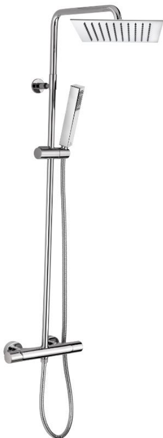
Immagine Prodotto - Product Image

настенная колонна из латуни Ø 20 мм – Душ TETIS 200x200 мм - CUBE Ручная лейка - держатель для лейки поворотный - Шланг латунный дв.фальцевания 150 см 1/2" FF конус - Смеситель термостатический с встроенным переключателем