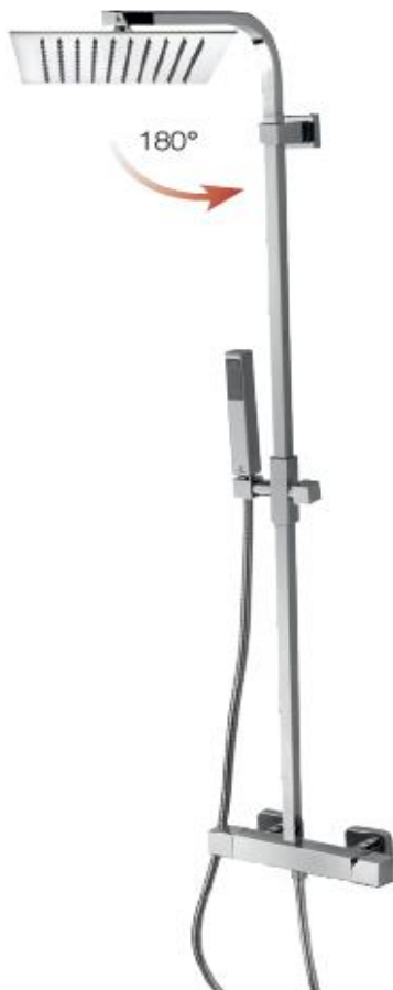
Immagine Prodotto - Product Image

Настенная колонна из латуни сечение 20 x 20 мм - душевая лейка TETIS 250 x 250 мм - ручной душ - держатель для душа фиксированный - гибкий шланг из латуни дв. фальцевания 150 см соединение 1/2" FF - смеситель Механический